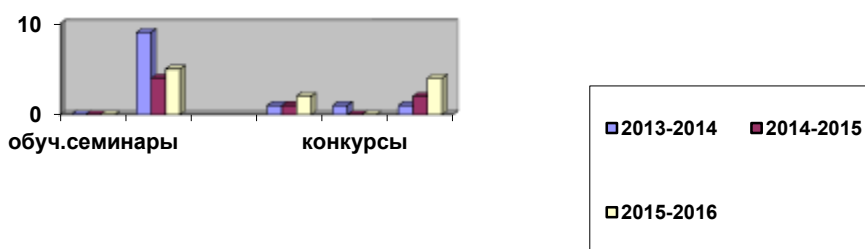
Диаграмма динамики активности Совета Школы

Наблюдается активность в плане участия членов Совета Школы в обучающих семинарах, в составе жюри областных мероприятий. Увеличилось количество встреч членов Управляющего совета с представителями власти, бизнеса, членами сельского совета Ромашкинского поселения, КО по вопросам лоббирования интересов школы. Возросло количество публикаций представляющих опыт деятельности